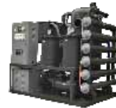
Maschine zur Aluminiumgewinnung