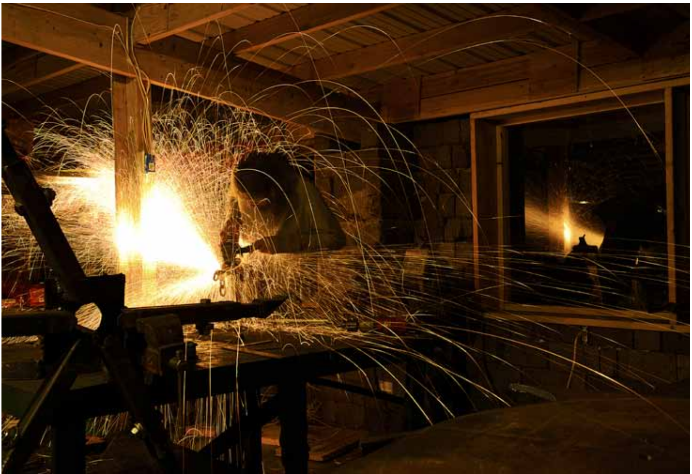
OBEN: Konstruktionsarbeiten am Traktor.